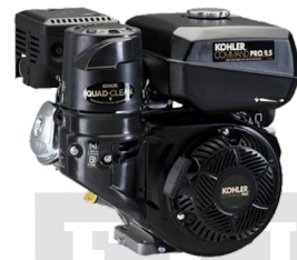
MOTOR A GASOLINA